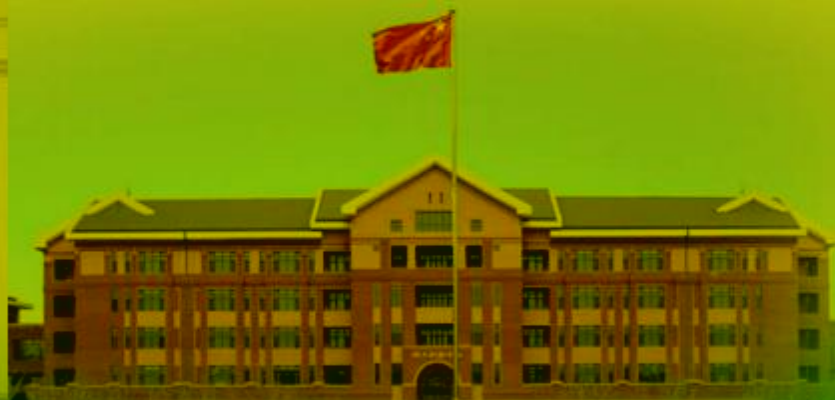
天津机电职业技术学院

TIANJIN VOCATIONAL COLLEGE OF MECHANICAL AND ELECTRICAL ENGINEERING